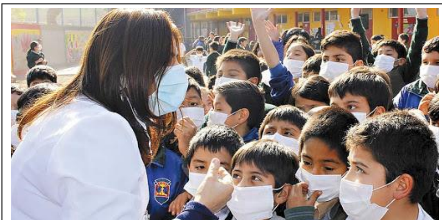
Uso de mascarillas: un ataque directo a la salud y al correcto desarrollo fisiológico e intelectual de los niños y niñas

Lo que sí existen son multitud de evidencias de que el uso prolongado de mascarilla provoca daños graves o fatales, entre ellos los asociados a los órganos más sensibles a deficiencias de oxígeno: cerebro (ictus, dolor de cabeza, desmayo con posible traumatismo), corazón (cardiopatías, infartos) y tejidos intersticiales (tumores).