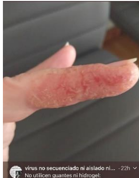
Protección de las manos: complemento ideal de las mascarillas