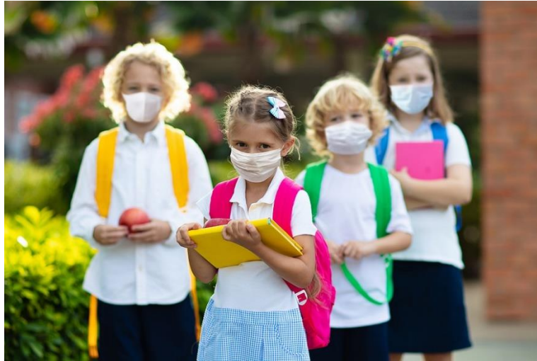
Una persona que respira a través de mascarilla recibe un 20 por ciento menos de oxígeno en cada inspiración, oxígeno que no puede utilizar su cerebro, ni sus pulmones, ni su metabolismo. En edades escolares y juveniles, este déficit causará estragos en su crecimiento y desarrollo

No hay evidencia científica de la eficacia de las mascarillas contra la transmisión de virus por el aire, pero sí hay evidencia científica de los peligros de usar mascarillas.